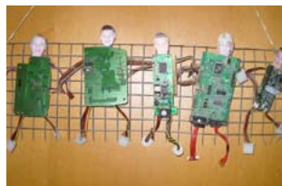
Schule Rogatsboden, Purgstall, Niederösterreich „TRASH - our very special way to use ICT“

Das europäische eTwinning-Siegel steht für die Anerkennung der Arbeit der Lehrpersonen, Schülerinnen und Schüler auf höchster europäischer Ebene. Die Gewinnerprojekte zeigen auf, welche großartigen Ergebnisse im Rahmen der eTwinning-Aktion möglich sind.