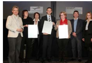
Nominierte Leonardo da Vinci-Projekte