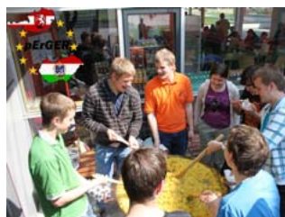
Höhere Technische Bundeslehranstalt Perg, Oberösterreich „pErGER – a guidebook for interschoolers“