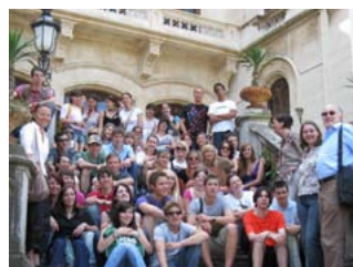
BG/BRG Ingeborg Bachmann, Klagenfurt, Kärnten „Sprachen, die uns verbinden – Lingue che ci uniscono“