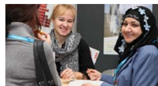
Infos einholen bei der Projektausstellung