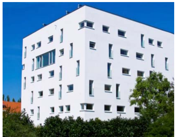
Das OeAD-Passivhaus in der Moserhofgasse in Graz