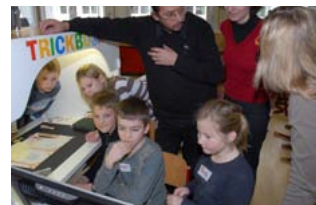
Volksschule Molln, Oberösterreich „Es war einmal ...“