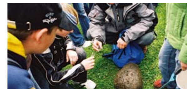
➤ Die Hauptschule 3 Spittal/Drau bei der eTwinning-Preisverleihung 2007 und bei ihrer Projektarbeit