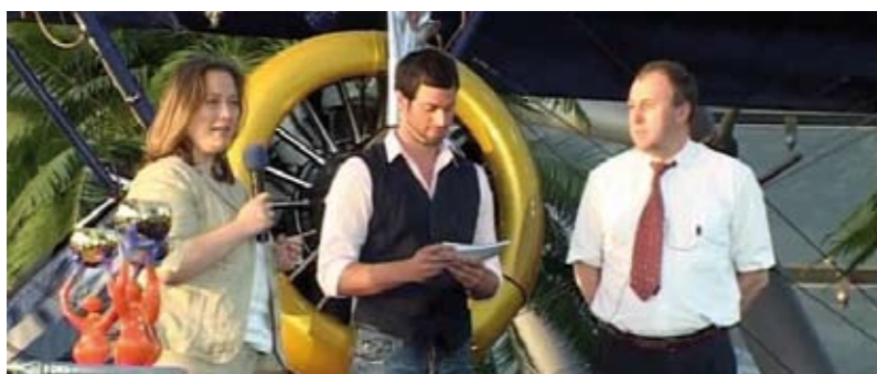
➤ Präsentation des eTwinning-Clips in Salzburg

Salzburger Flughafen – an der unter anderem Landeshauptfrau Gabi Burgstaller und Vertreterinnen und Vertreter des BMUKK teilnahmen – bildete nicht zuletzt deshalb den idealen Rahmen zur Präsentation des ersten eTwinning-Clips der Nationalagentur Lebenslanges Lernen, der von Ursula Großruck vorgestellt wurde. Der Clip präsentiert eTwinning in 50 Sekunden und wird seither bei Schulungen, Messen und sonstigen Infoveranstaltungen eingesetzt.