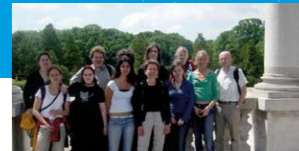
➤ Die Gewinnerinnen und Gewinner des ersten österreichischen eTwinning-Preises