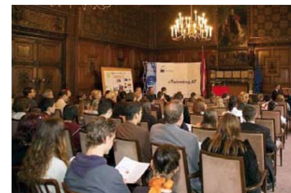
› Die eTwinning-Preisverleihung im Haus Niederösterreich