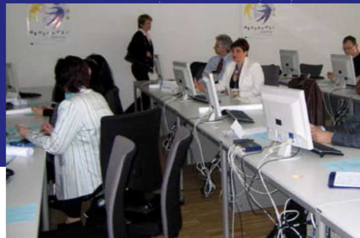
➤ eTwinning-Promotorinnen und -Promotoren beim Kennenlernen von www.etwinning.net

Bei dieser Veranstaltung – an der mehr als 300 Personen aus ganz Europa teilnahmen – wurde das eTwinning-Portal ( www.etwinning.net ) offiziell gestartet. Im Mittelpunkt der Konferenz stand die interkulturelle Verständigung durch IKT sowie die generelle Bedeutung von Bildung für den europäischen Integrationsprozess. Die nationale Auftaktveranstaltung in Österreich fand bereits im Herbst 2004 statt.