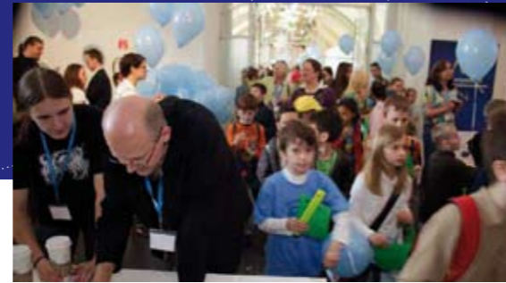
› Europa im Klassenzimmer im Wiener Museumsquartier

An den drei Tagen beschäftigten sich die Teilnehmerinnen und Teilnehmer vor allem mit dem breiten Feld der Gesundheitserziehung in Schulen, der Entwicklung von eigenen Projektideen,