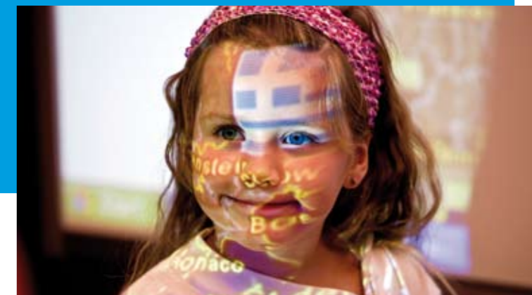
➤ Eine junge eTwinnerin vor einem interaktiven Whiteboard Hauptpreis bei den eTwinning-Preisverleihungen – zur Verfügung gestellt von SMART Technologies (Germany) GmbH