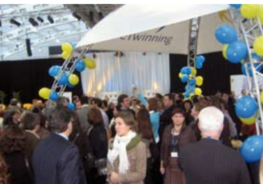
› Die eTwinning-Jahreskonferenz in Linz

Das Programm bietet eine Mischung aus Workshops, Diskussionsrunden und Länderberichten. Zudem werden die europäischen eTwinning-Preise vergeben.