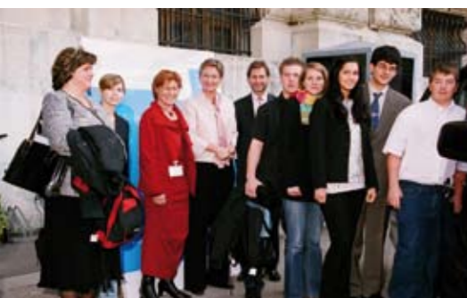
➤ BM Schmied und BM Hahn bei der Auftaktveranstaltung des Programms für lebenslanges Lernen

Die offizielle Auftaktveranstaltung zum Programm für lebenslanges Lernen ging in Österreich am 5. März in der Wiener Hofburg über die Bühne. Die Veranstaltung stand im Zeichen der europäischen Bildungsschwerpunkte. In thematischen Foren erhielten die Besucherinnen und Besucher Gelegenheit, diese Schwerpunkte mit Expertinnen und Experten zu diskutieren. Rund 700 Festgäste – darunter Wissenschaftsminister Johannes Hahn und Unterrichtsministerin Claudia Schmied – kamen, um mehr über die Neuerungen, Ziele und Möglichkeiten der neuen Programmgeneration zu erfahren. eTwinning wurde im Zuge des Starts des Programms für lebenslanges Lernen mit 1. September 2007 Teil von Comenius.