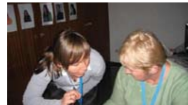
› eTwinning-RDW in Innsbruck

dem pädagogisch-fachlichen Potential von eTwinning sowie den Möglichkeiten zur Kombination von eTwinning mit anderen Comenius-Aktionen.